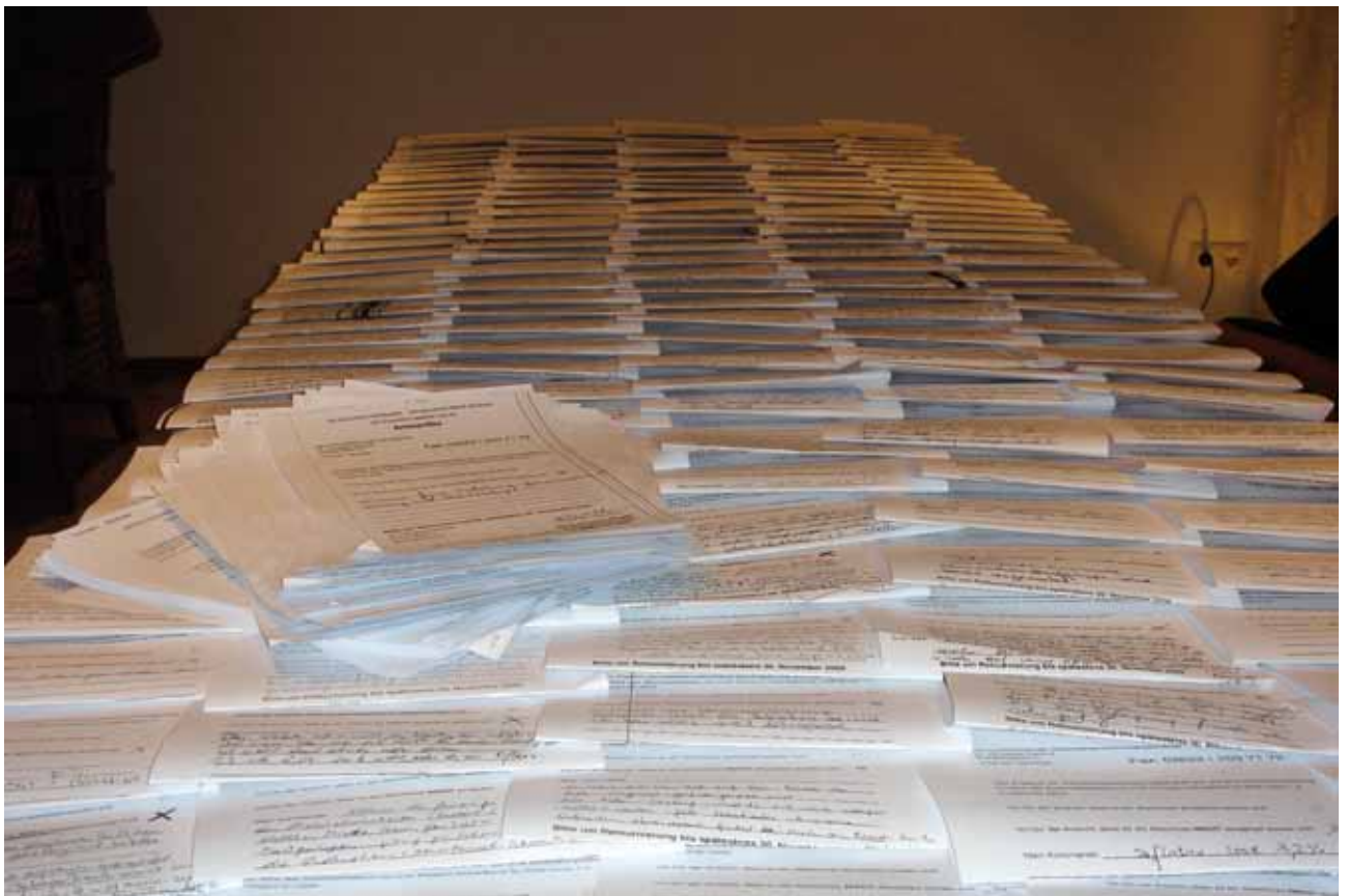
Selbst ein Esszimmertisch für zwölf Personen war für die Berge an Rückmeldungen um Dimensionen zu klein ...

Das heurige Verhandlungsergebnis geht aus meiner Sicht genauso an den Vorstellungen der Ärzteschaft vorbei. Die Rückmeldungen belegen zweifelsfrei durch Menge und Abstimmungsverhalten was die Basis wirklich will. Auch die Kommentare sprechen Bände. Diesen ist übrigens deutlich zu entnehmen, dass die Basis sehr wohl verstanden hat, was bei der